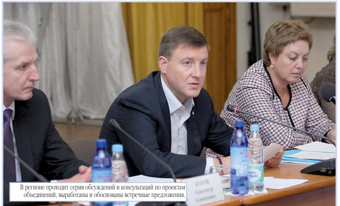
В регионе проходит серия обсуждений и консультаций по проектам объединений, выработаны и обоснованы встречные предложения.